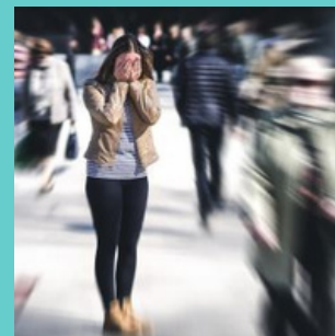
3. Uitdagingen & risico's